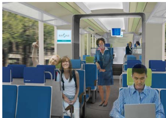
RCP Design global pour RhônExpress