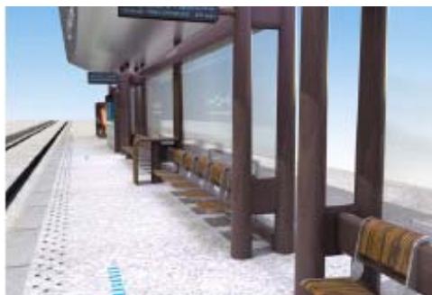
RCP Design global pour RhônExpress

Pour aller à l'aéroport , trois stations desservent Leslys: Lyon Part-Dieu, La Soie et Meyzieu ZI. La station Lyon Part-Dieu est située à côté de la station Lea, à l'est de la gare de la Part-Dieu, côté Vilette.