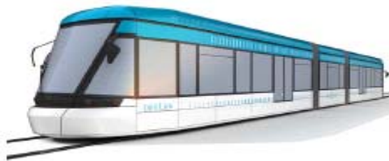
RCP Design global pour RhônExpress

Leslys et Lea se partagent la même infrastructure entre La Part-Dieu et Meyzieu ZI. Comme le service Leslys est plus rapide que le service Lea (Leslys a moins d'arrêts que Lea), des zones de dépassement ont été prévues lors de la construction de la voie. Au delà de Meyzieu ZI, seul le service Leslys circule. La voie, sur les 7 km reliant Meyzieu ZI au site aéroportuaire, n'est pas construite. Ces travaux débiteront en 2008, et se dérouleront sur 18 mois.