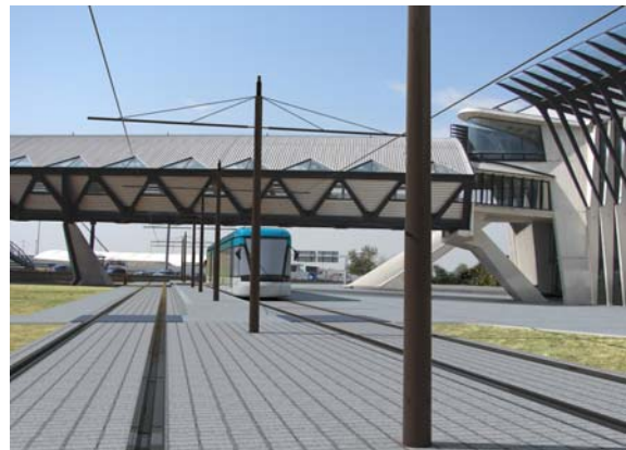
RCP Design global pour RhônExpress

Aujourd'hui, le site de Saint-Exupéry est uniquement desservi depuis Lyon en transports collectifs, par SATOBUS, une desserte en autocar efficace mais soumise aux aléas de la circulation. Leslys assure un accès rapide (25 mn car en site propre), une fiabilité horaire incomparable, (un tramway toutes les 15 minutes en heure de pointe).