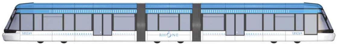
RCP Design global pour RhônExpress

Leslys est la liaison express qui reliera par tramway en 25 mn, le centre de Lyon depuis La Part-Dieu au site de Saint-Exupéry (gare et aéroport). Leslys sera construite en majeure partie sur la voie ferrée désaffectée du Chemin de fer de l'est lyonnais (CFEL), propriété du Département du Rhône, sur laquelle circule jusqu'à Meyzieu depuis décembre dernier, Lea le tramway de l'est lyonnais.