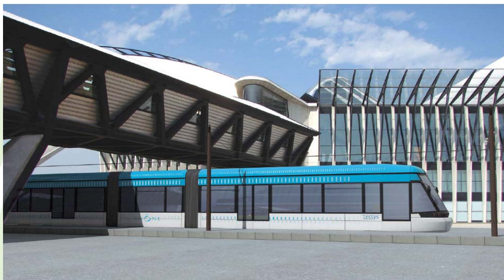
RCP Design global pour Rhônexpress